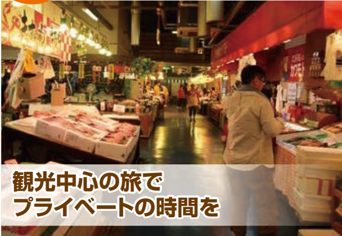
観光中心の旅で プライベートの時間を